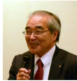
氏家幹事 幹事報告