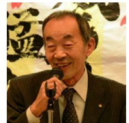
伊賀副会長 閉会挨拶