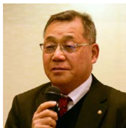
稲毛会長 会長挨拶