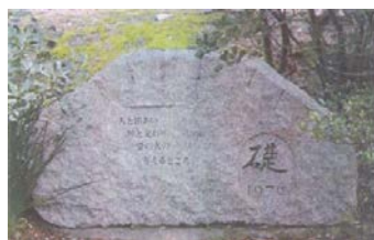
元RI理事長の故今井鎮雄先生 礎石より

ロータリーの目的は、意義ある事業の基礎として奉仕の理念を奨励し、これを育むことにある。具体的には、次の各項を奨励することにある。