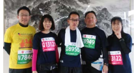
丸亀ハーフマラソン 5人全員完走できました！