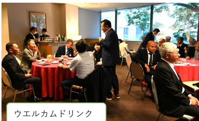
ウエルカムドリンク