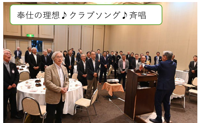
奉仕の理想 ♪ クラブソング ♪ 斉唱