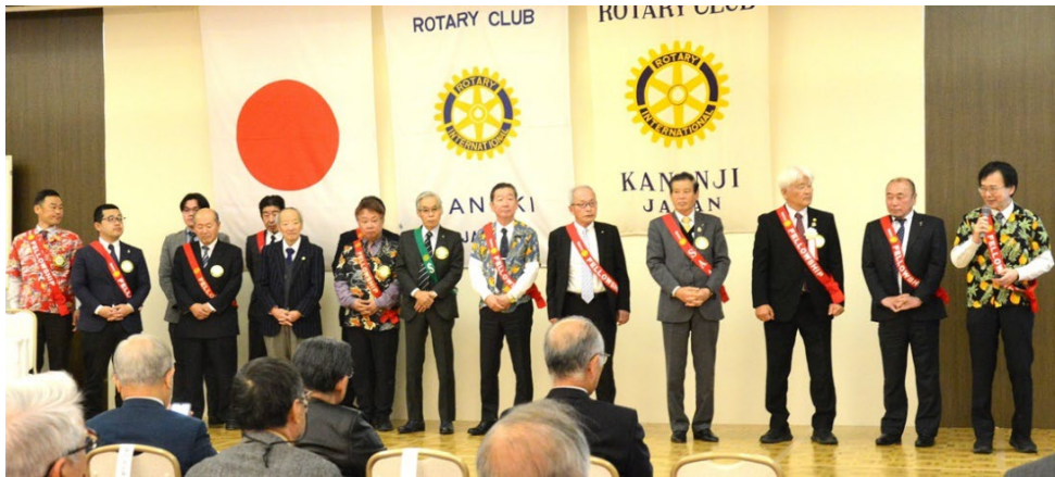
さぬきロータリークラブの皆様