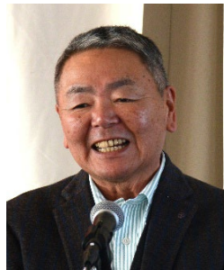
前山S A A