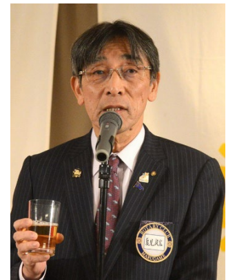
夏見ガバナー；乾杯