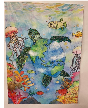
【審査委員長・速水史朗賞】