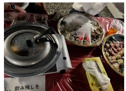
菜を里の特製鍋料理