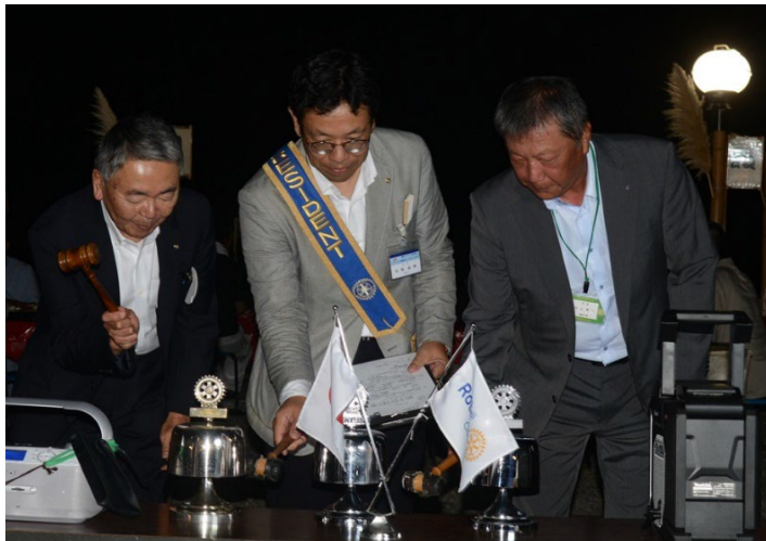
丸亀東RC・善通寺RC・観音寺東RCの会長が点鐘

*丸亀東RC 20名・観音寺東RC 15名・善通寺RC 23名 合計58名の参加でした。