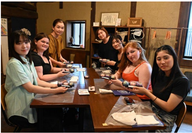
寶月堂にてお菓子作り