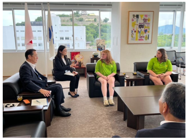
丸亀市長表敬訪問