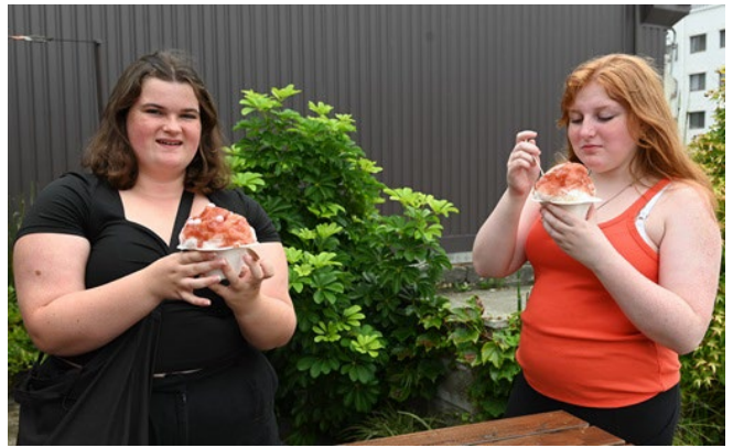
寶月堂にてかき氷