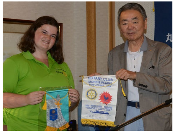
バナー交換(アビーさん)