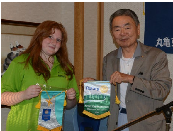
バナー交換(スカイラーさん)