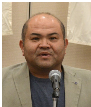
中 哲生 出席