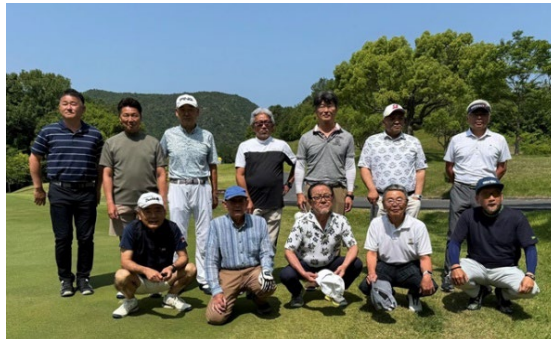
【鬼ノ城ゴルフクラブ】