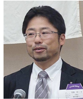
安藤ガバナー補佐