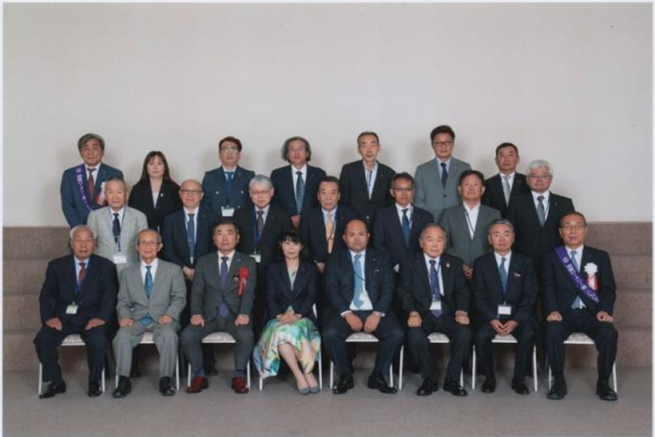
(丸亀東ロータリークラブ様) 丸亀ロータリークラブ創立60周年記念 令和5年6月3日 於:オークラホテル丸亀