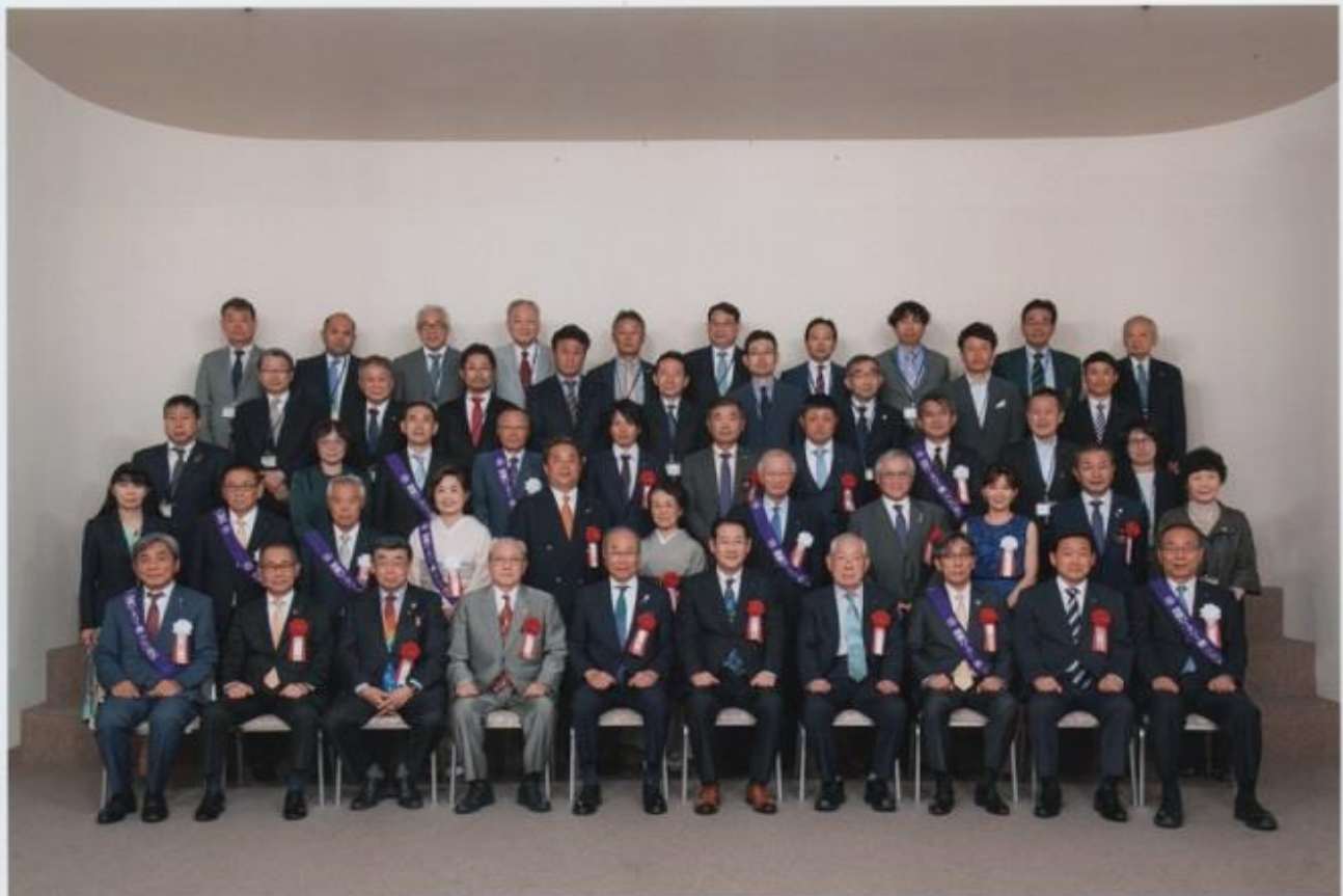
(来賓) 丸亀ロータリークラブ創立60周年記念 令和5年6月3日 於:オークラホテル丸亀