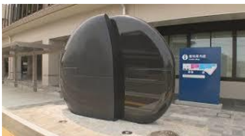
多度津町新庁舎モニュメント 「出会い」