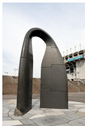
丸亀競技場モニュメント 「記録の門」