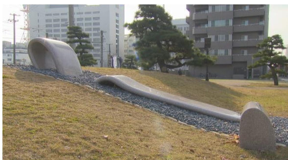
玉藻城が見渡せる絶好の場所 「SETO（セト）」