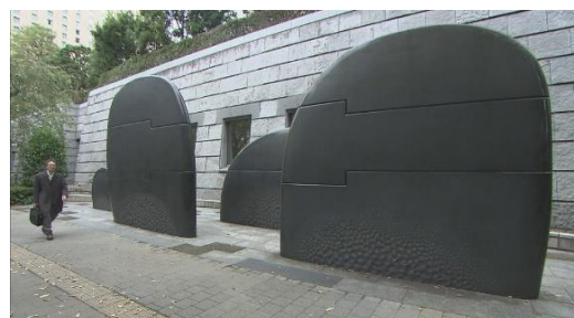
東京都庁「宇宙からのメッセージ」