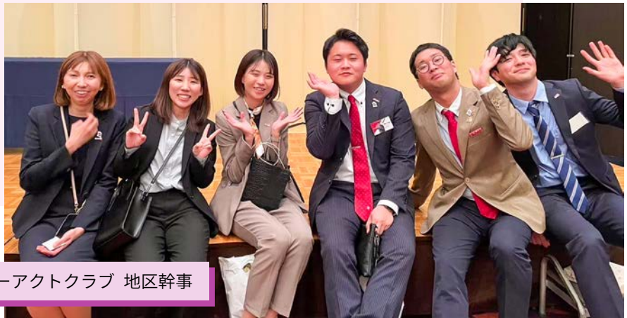
2023-2024年度 友好地区ローターアクトクラブ 地区幹事