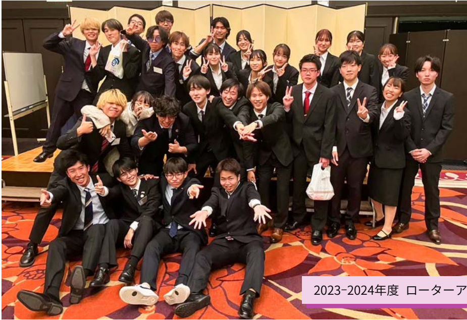
2023-2024年度 ローターアクトクラブ 学生会員