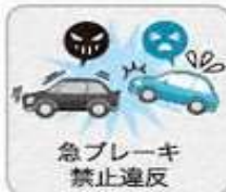
急ブレーキ禁止違反