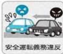
安全運転義務違反