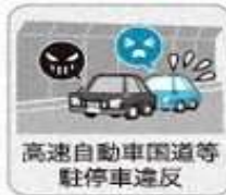
高速自動車国道等 駐停車違反

●「思いやり・ゆずり合い」の運転を！ ●ドライブレコーダーをつけましょう！ ●あおり運転を受けたときは、車外に出ることなく110番を！