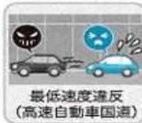
最低速度違反 (高速自動車国道)