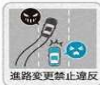
進路変更禁止違反