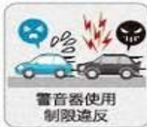
警音器使用制限違反