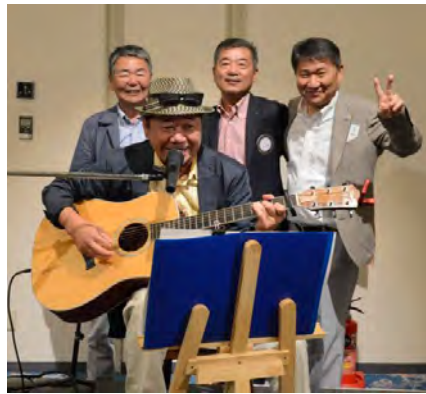
ビートルズ～70年代ポップス サイモン&&ガーファンクル etc 音楽